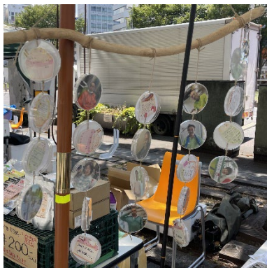
「シャーレーと流木を使った寄せ書き」