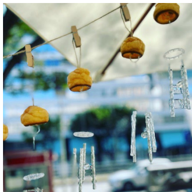
「本物のシュー皮を使った風鈴」