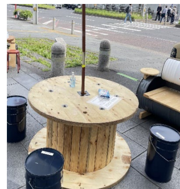
「今回もケーブルドラムテーブルと ペール缶チェア等をレンタル提供」

アップサイクル製品の販売・オーダーメイド承ります。各種イベント・マルシェへのレンタル・設置もお気軽にご相談ください。