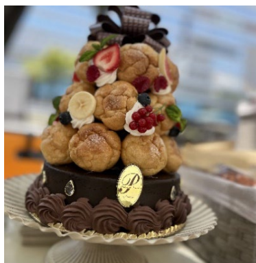
「シュー皮とフェイクスイーツのクロカンパッシュ produce by Doux Repos