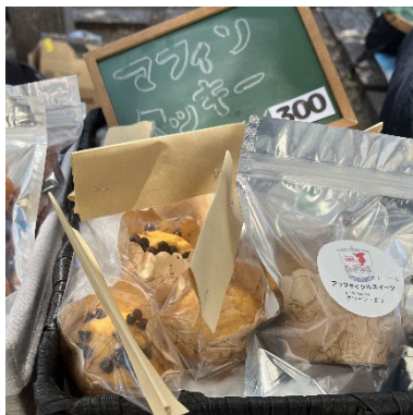
「おからマフィンとおからクッキー」