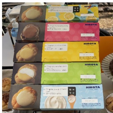
「特別販売したヒロタのシュークリーム」