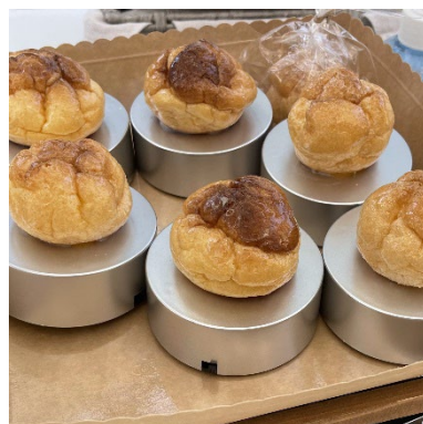
「本物のシュー皮を使ったライト」