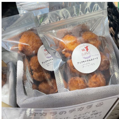
「おからのサーターアンダギー」