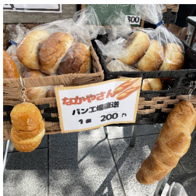
「なかや工場直送のテーブルロール」