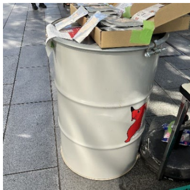
「他店さんにて使用中のドラム缶」