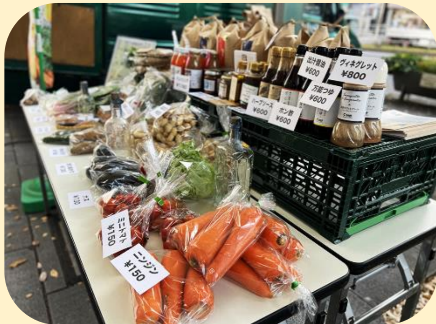
●規格外野菜など (千バベジ) 正規のルートでは販売できない、行き場のない野菜など