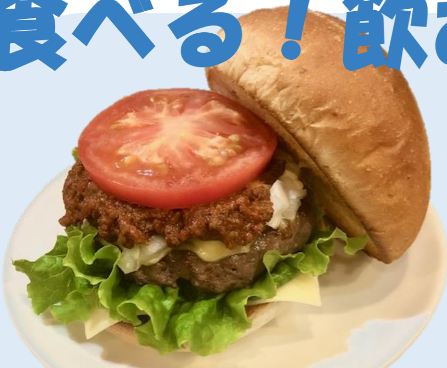
●ジビエバーガー (羊と鹿ととときどき猪) 害獣として駆除されるジビエをお料理に