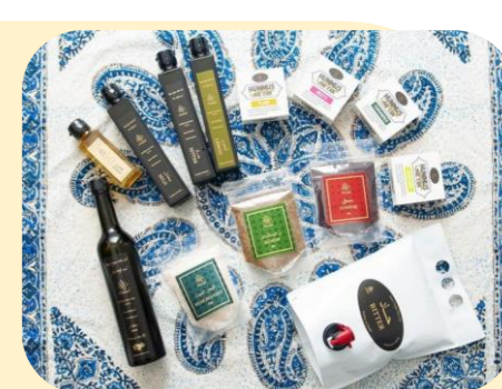
●オリーブオイル (MURADO) 中東ヨルダンの生産者が情熱を込めて 作ったオリーブオイル