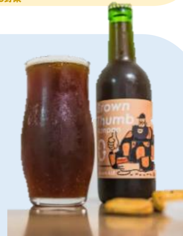
●クラフトビール (Beer the First) 廃棄間近の食材をビール製造でアップサイクル