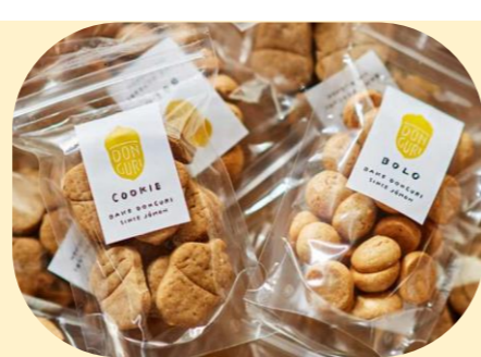
●どんぐりクッキー・ポーロ (加曽利貝塚ともに生きるプロジェクト) 福祉事業所など市民参加で作上げた焼き菓子