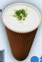
●抹茶ラテ (お茶カフェ大川園) 竹炭をフレンドしたアップサイクルラテ

写真は全てイメージです。出店者、商品に変更となる場合があります。(★…福祉事業者)