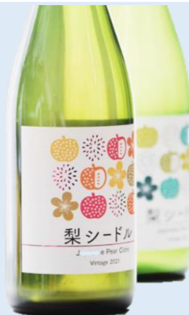
●梨シードル (ワインショップアテカ) 活用できない梨をシードルにアップサイクル