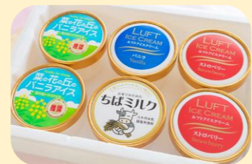
★アイスクリーム (オリーブの樹) 地域の酪農家の協力のもと開発した ルフトアイスクリーム