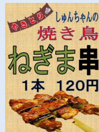
★焼き鳥 (ビーアンビシャス) 鶏肉の下処理から障がいのある方が調理した焼き鳥 野菜は規格外商品を使用