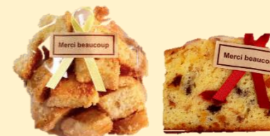
★ラスク・パウンドケーキ (明朗塾) 障がいのある方が心を込めて生産した商品