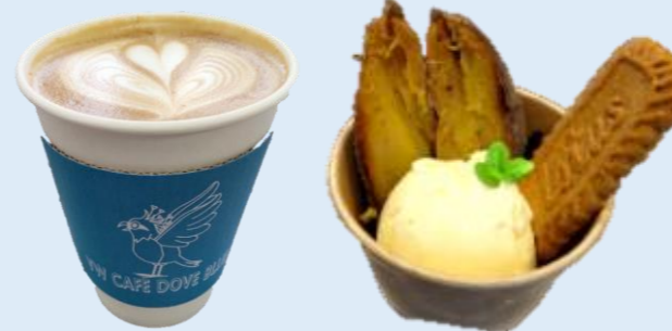
●コーヒー、焼き芋 (VW CAFE DOVE BLUE) 規格外のお芋を使った焼き芋、 自家焙煎オーガニックコーヒーなど