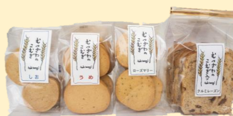
★焼き菓子・乾燥野菜 (千葉県障害者就労事業振興センター) 小麦クッキー・農福連携で生産した野菜