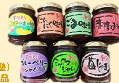
★味噌・ジャム (高柳福祉会) 材料はすべて国産の物を使用 日本の伝統味噌づくりで自社製造