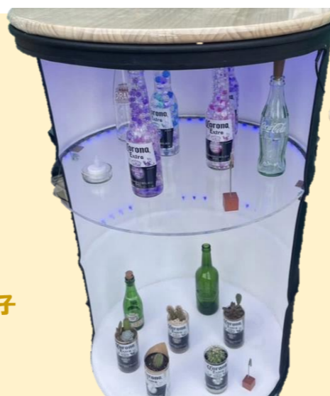
●廃材利用の家具 (グリーン・エコ) 廃棄されるドラム缶などを再利用した椅子や テーブルの展示・販売