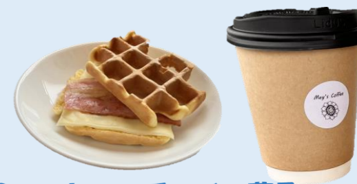
●コーヒー・チャイ・菓子 (Mey's Coffee) 環境に配慮したオーガニック生産