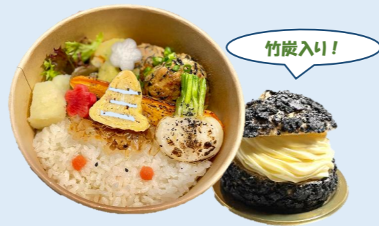
●焼き菓子、お弁当 (野-inacaya-) 竹炭を使った焼き菓子など